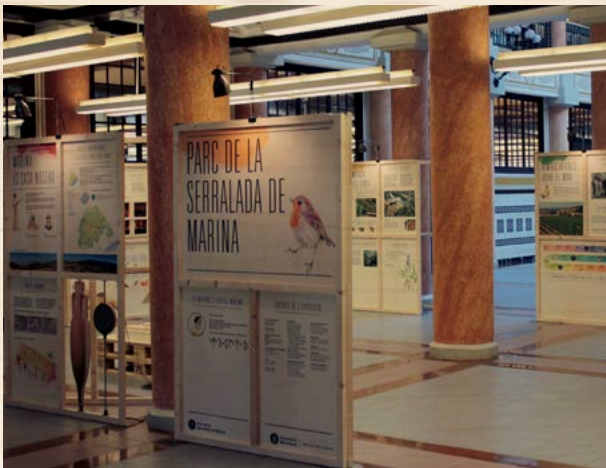
Exposició El Parc de la Serralada de Marina

Parc de la Serralada de Marina és una exposició en què la Marina, una jove laietana que va viure en el poblat ibèric de les Maleses, ens descriu els diversos aspectes del Parc, des del paisatge, la vegetació i la fauna, fins als objectius que cal tenir en compte per protegir-lo i garantir-ne un ús públic respectuós.